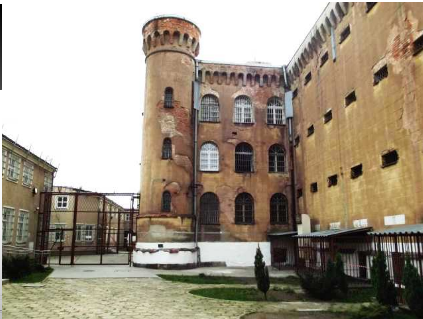
Widok na mury Zakładu Karnego w Kaliszu przy ul. Łódzkiej 2