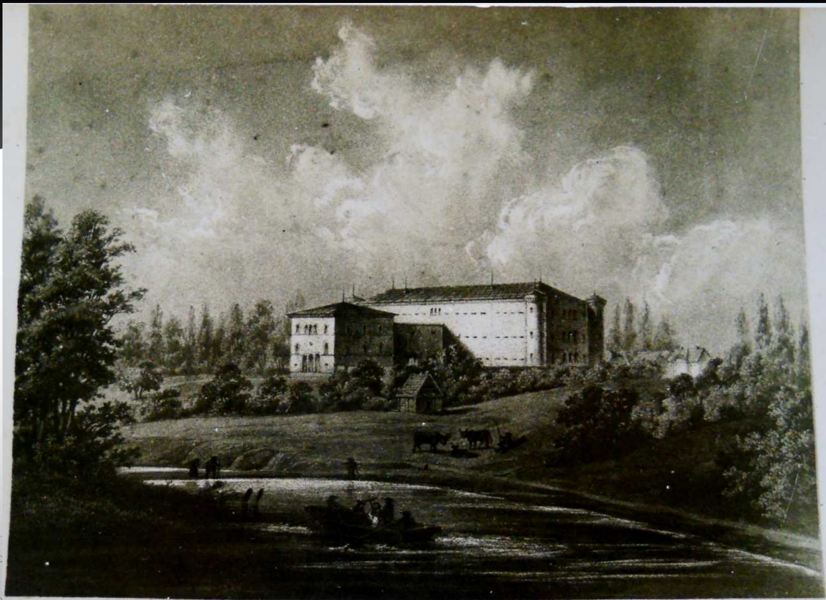
Więzienie i Sąd Poprawczy w roku 1842