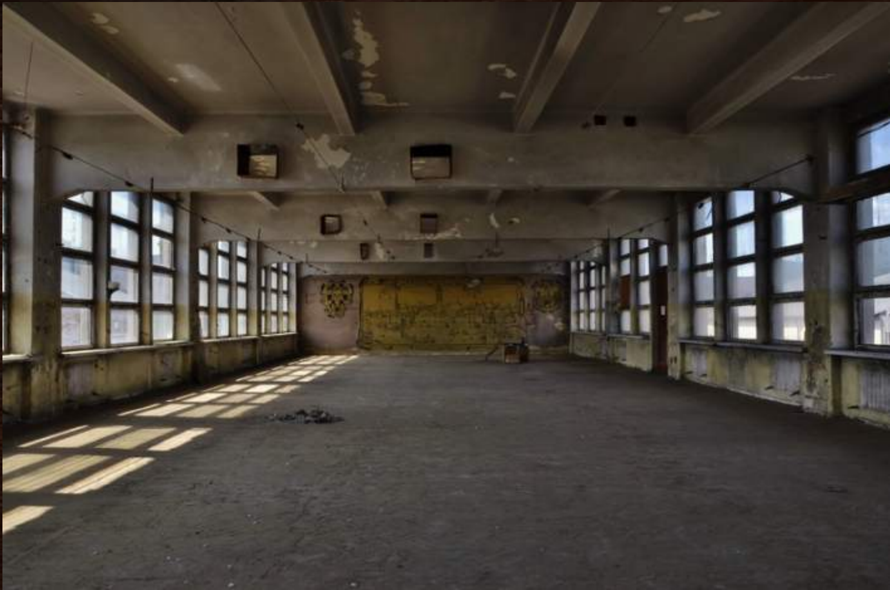
Wnętrze budynku fabryki obecnie