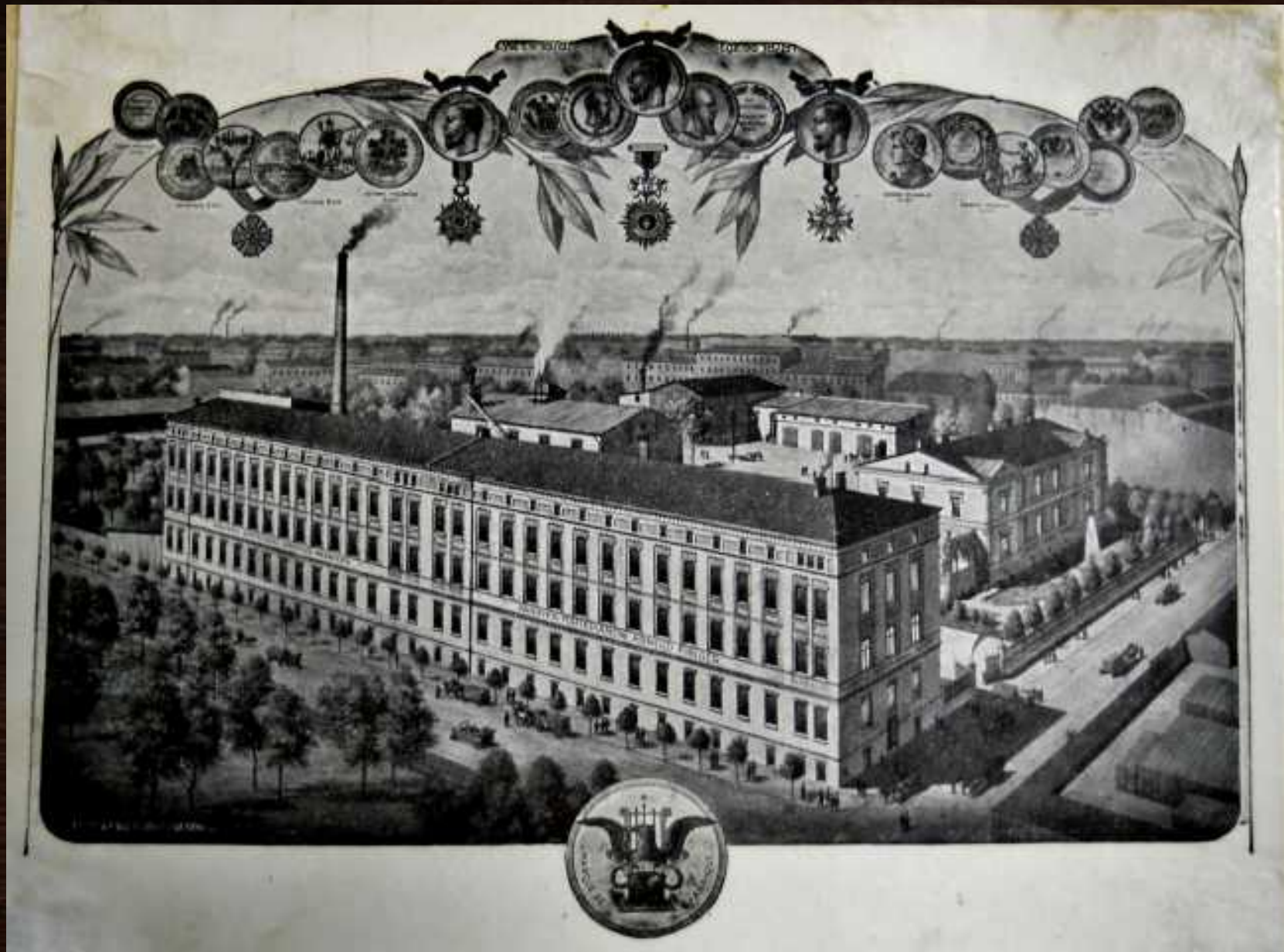
Budynek Fabryki Fortepianów i Pianin Arnolda Fibigera, z końca XIX w.