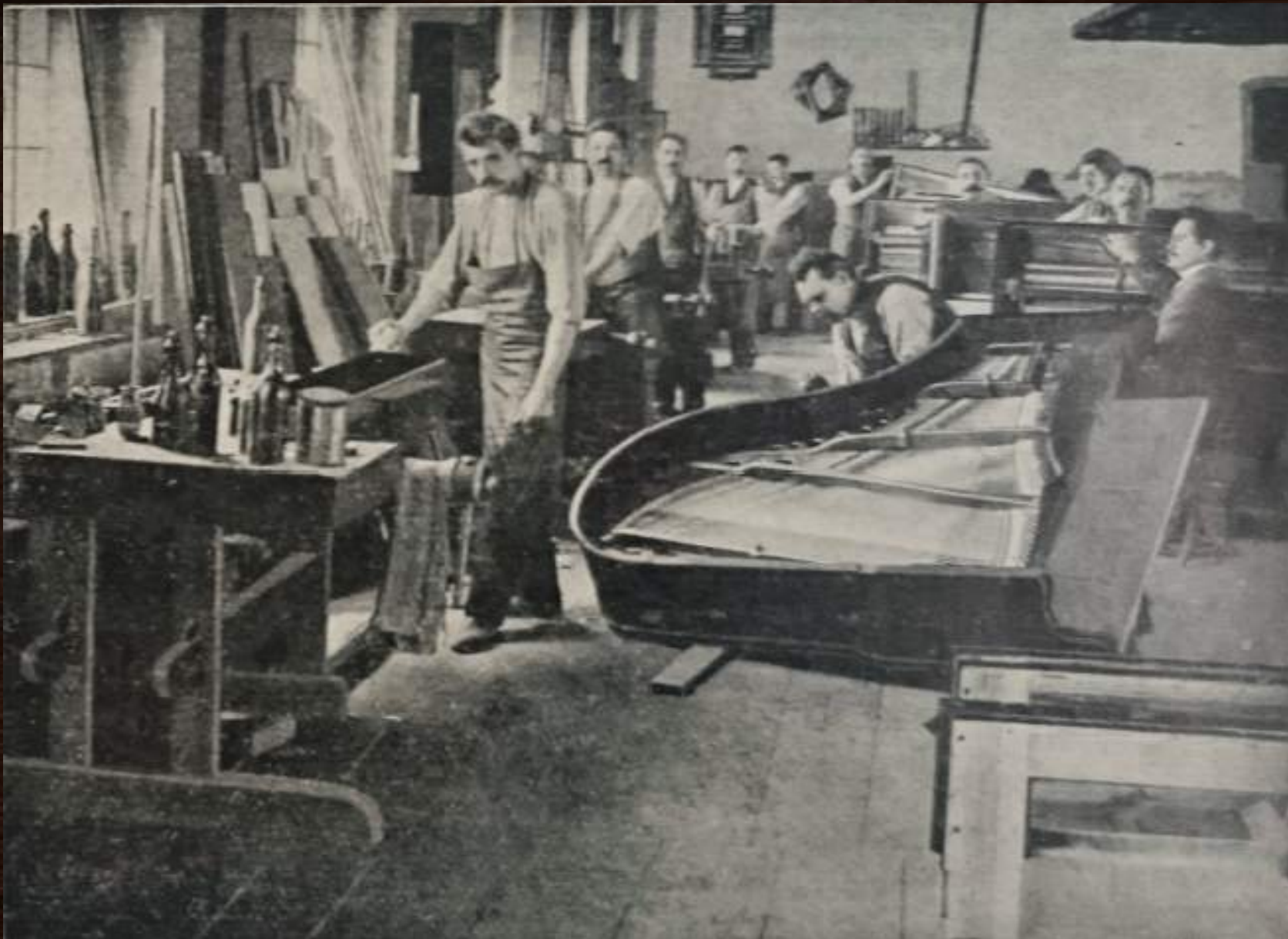
Zdjęcie wnętrza fabryki zamieszczone w gazecie