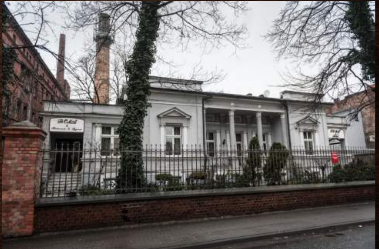
Dawna willa Fibigerów, obecnie restauracja i hotel