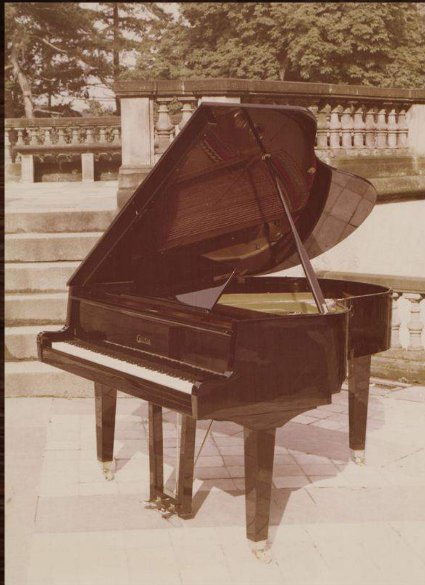
Fotografia reklamowa wyrobów Kaliskiej Fabryki Fortepianów i Pianin "Calisia" w Kaliszu z połowy lat 70. XX w. wykonane na zamku w Gołuchowie