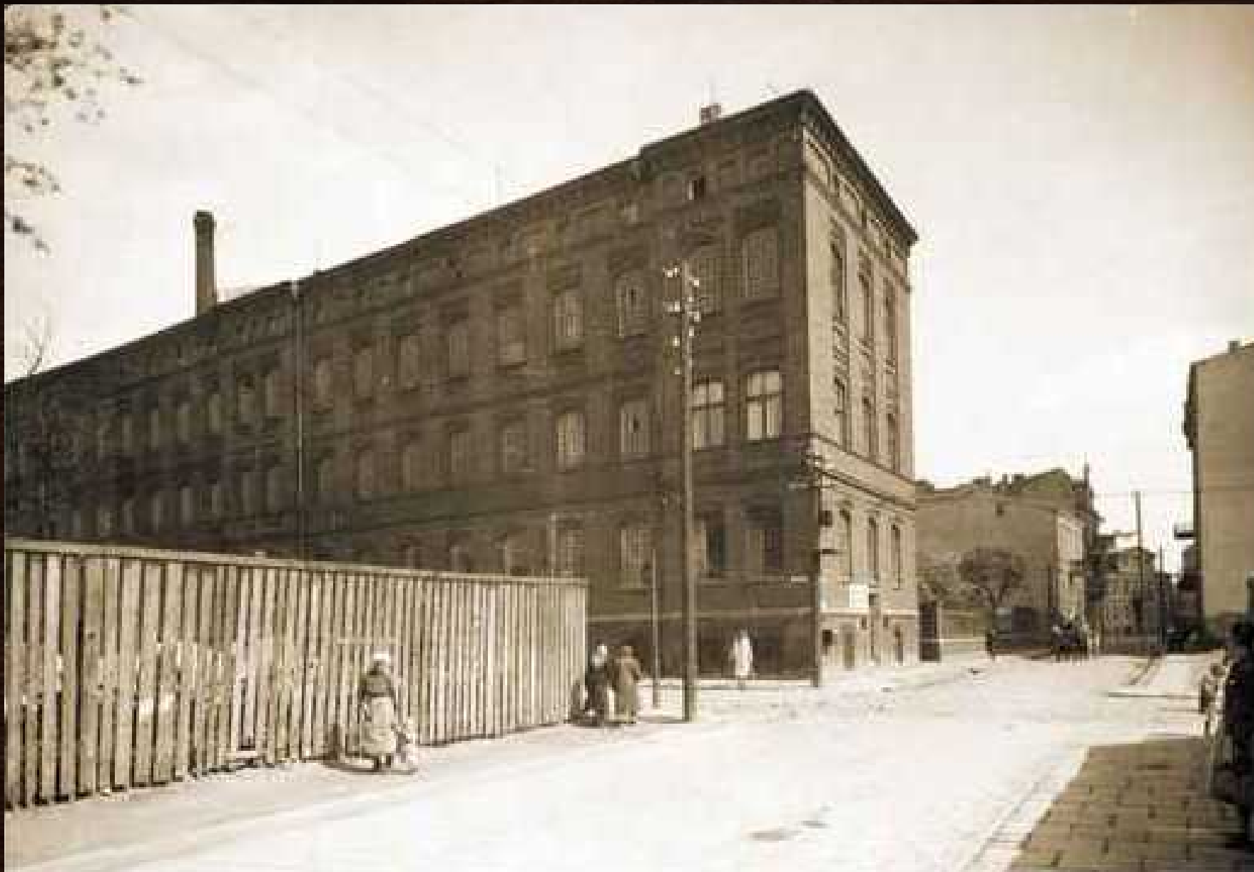
Budynek Fabryki Fortepianów i Pianin Arnolda Fibigera, z lat II wojny światowej