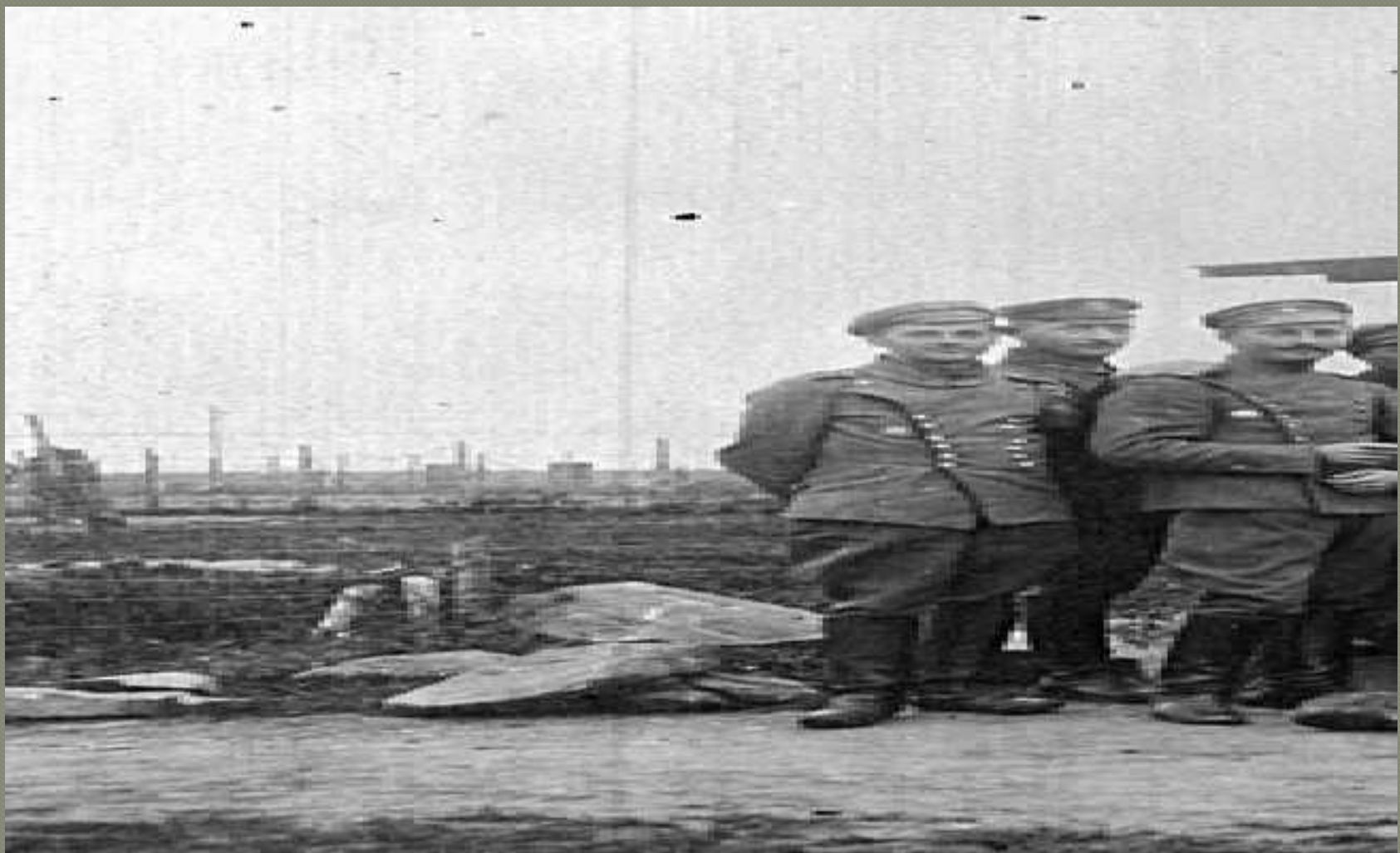
Obóz dla internowanych legionistów w Szczypiornie.