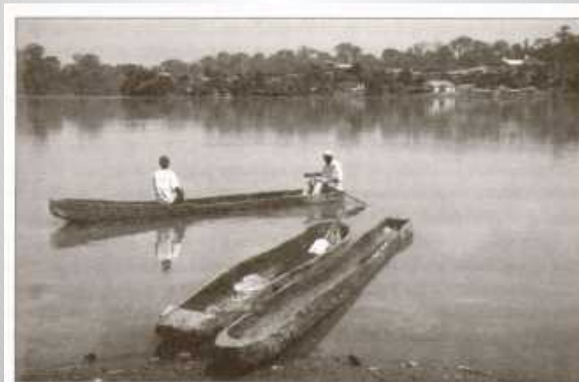
3. Jezioro Barombi-ba-Kotta

Z końcem 1886 roku Stefan Szolc Rogoziński, powrócił na Czarny Ląd, gdzie kupił plantację kakao na wyspie Fernando Po i osiedlił się na niej wraz z żoną. Plantacja nie przyniosła przewidywanych dochodów potrzebnych na dalsze ekspedycje badawcze. Po krótkim jeszcze pobycie w Egipcie, schorowany badacz Kamerunu powrócił latem 1893 roku do kraju. Owładnięty jednak planami dalszych wypraw badawczych, wyjechał w roku 1896 do Paryża, gdzie 1 grudnia poniósł śmierć pod kołami omnibusa. W kraju krążyła wersja, rozpowszechniana przez żonę, że zmarł na chorobę tropikalną na wyspie Fernando Po.