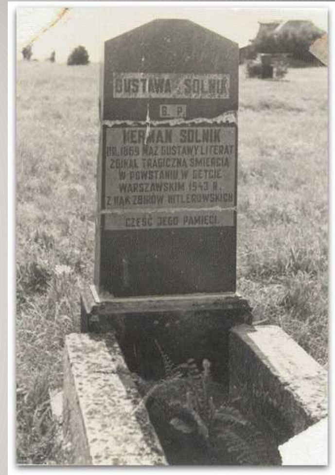
Symboliczny grób Hermana Solnika na cmentarzu żydowskim