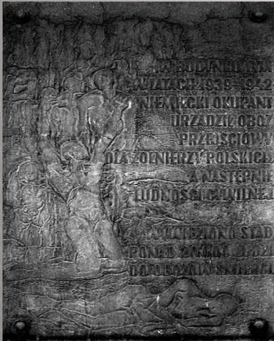
Dawny wygląd tablicy

„W budynku tym w latach 1939-42 niemiecki okupant urządził obóz”