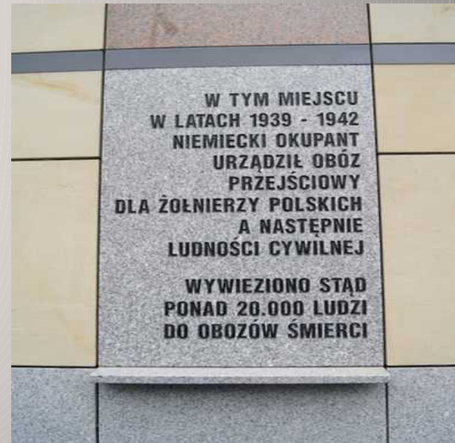
Obecny wygląd tablicy