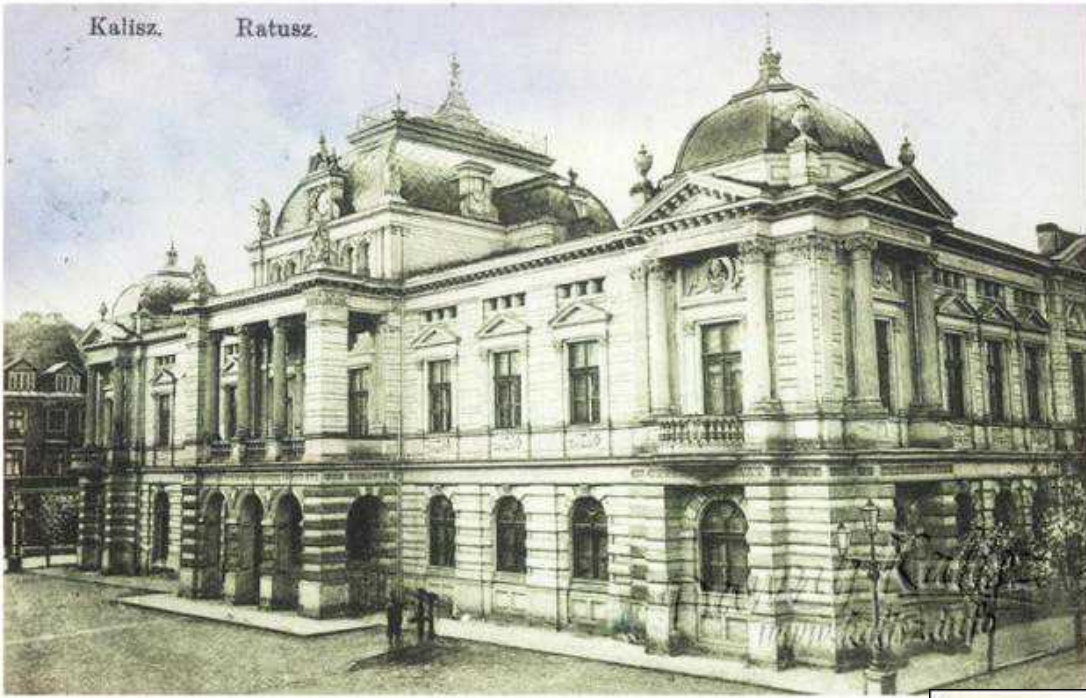
Ratusz miejski. Pocztówka koloryzowana z 1912 roku